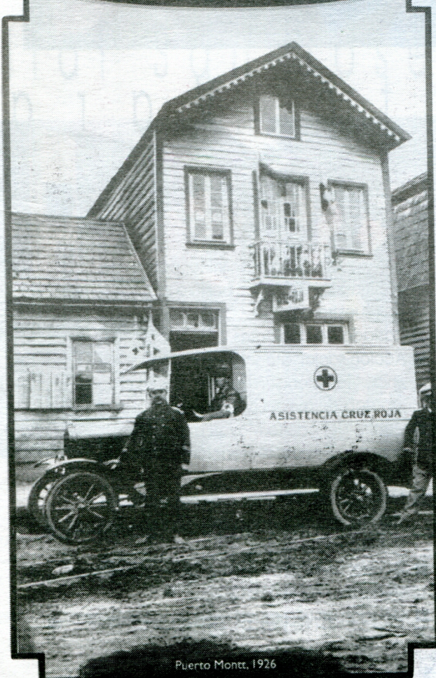
Puerto Montt, 1926