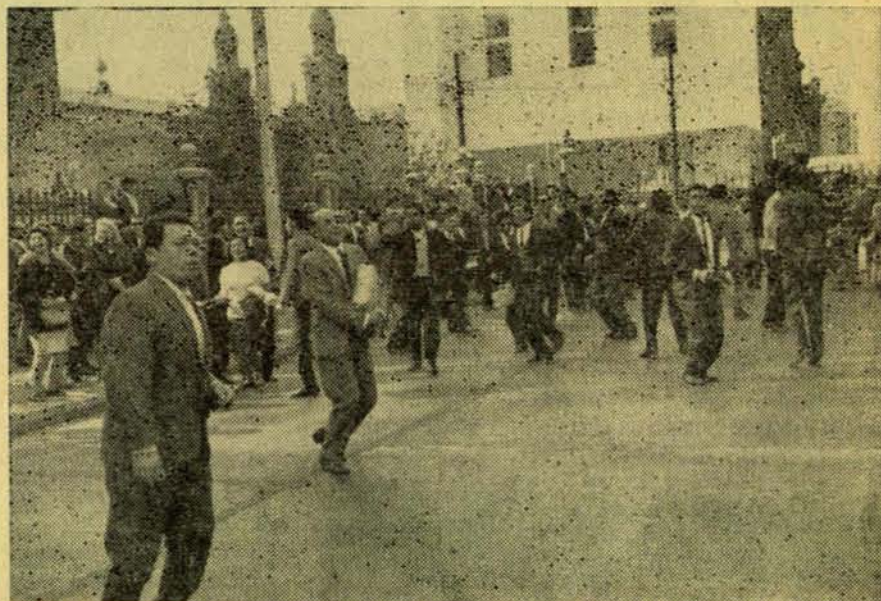
"Nuestra Libertad la debemos sólo a la Solidaridad de los obreros y estudiantes".

El sindicato de SABA no estaba afiliado a la C.U.T. Pertenecía a la FETELMET (Federación Electro Metalúrgica).