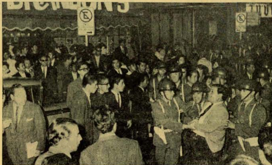
"Sólo las acciones colectivas son eficaces".

Por este motivo yo decidí renunciar a la H. Junta de Conciliación, pues no quería seguir haciéndome cómplice de esta farsa".