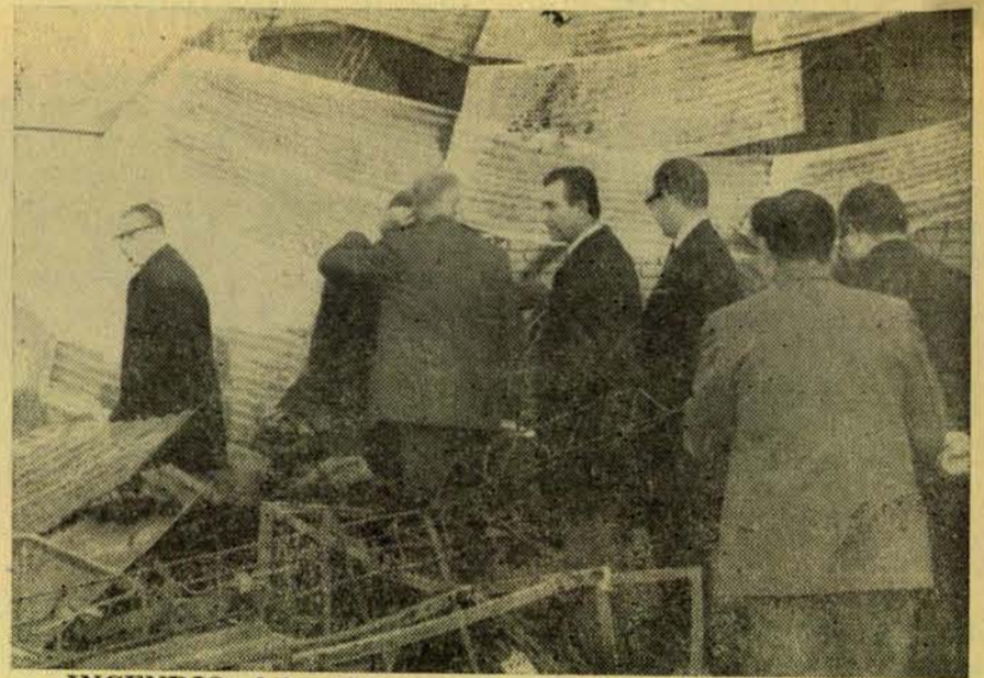
INCENDIO: A los obreros se les mantuvo detenidos 9 meses; los empresarios obtuvieron grandes créditos y franquicias para seguir su negocio...

Por una parte estaba el interés de los sectores patronales (SOFOFA, ASIMET, etc). de obtener un castigo ejemplar para los trabajadores y que significara un arma patronal decisiva en todas las negociaciones.