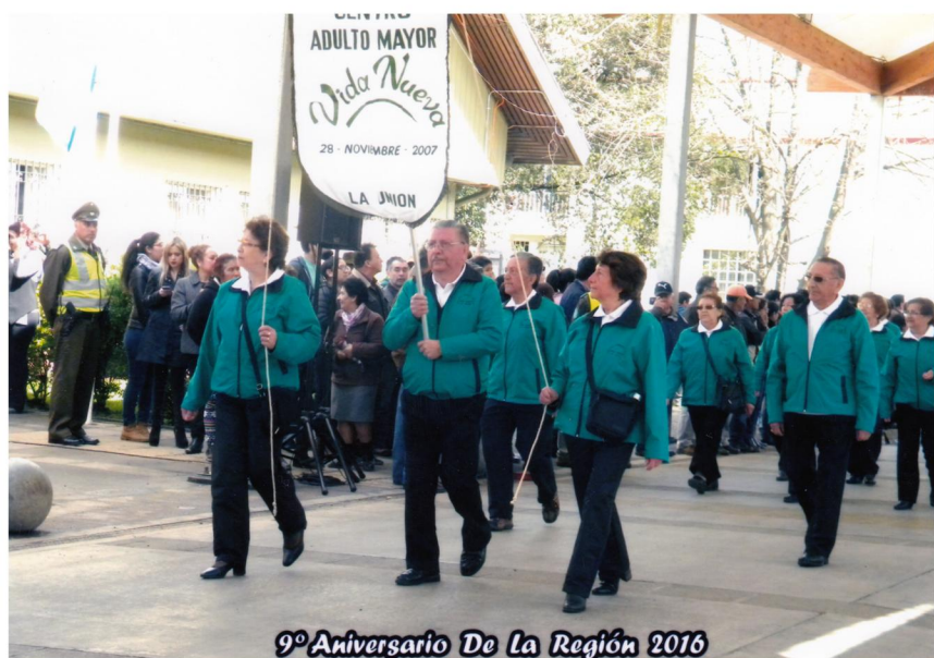
9º Aniversario De La Región 2016