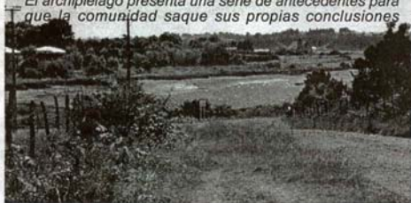
La empresa que se instalaría en la punta de Caicaén, contempla una inversión de 8,4 millones de dólares

La instalación de una empresa siempre es importante pero hay que sopesar las ventajas y desventajas. Revista El archipiélago presenta una serie de antecedentes para que la comunidad saque sus propias conclusiones