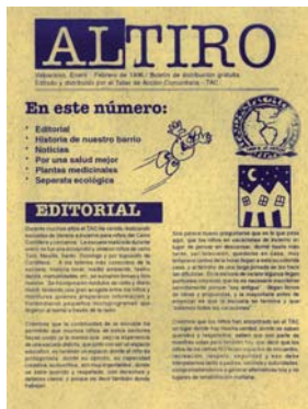
Boletín “Al tiro”. Valparaíso. Enero-febrero de 1990. Donado por Patricia Castillo Iribarren.

1 Archivo digital de documentos (fotografías, impresos, manuscritos, etc.).