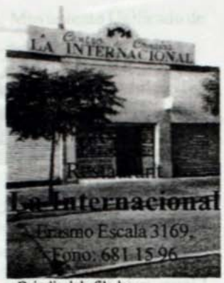
Brindis del afilador

¡18.446.744.073.709.551.615 granos de trigo! Para producir tal cantidad de trigo, habría que sembrar setenta y siete veces todos los continentes de la tierra.