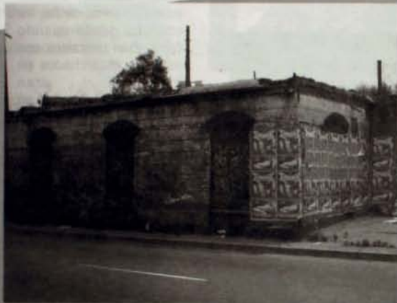
Estación de Trenes Yungay año 2004