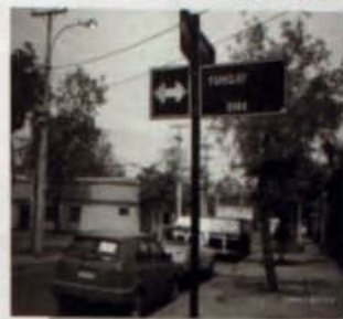
La calle Yungay en pleno Barrio Balmaceda