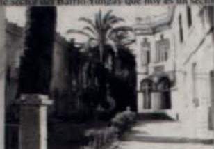
Pasaje Adriana Cousiño

La construcción, en terrenos más pequeños, de pasajes y cités con casa de varios pisos, al estilo romántico europeo, cambió la forma de vivir de un importante sector del Barrio Yungay que hoy es un sector de conservación.