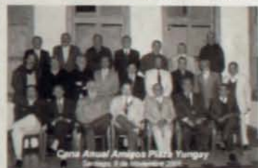
Como Amigos Plaza Yungay

"Me interesa destacar el tema Mapuche, me crié en medio de su cariño, les conozco desde cuando caminaban descalzos con sus pies escarchados en invierno y eran compañeros de asiento en la vieja escuela rural. Ahora exhibo mi trabajo en la Plaza Yungay gracias a los buenos oficios del Comité de Adelanto y trato, junto con vender, contribuir con un grano de arena a la difusión del arte