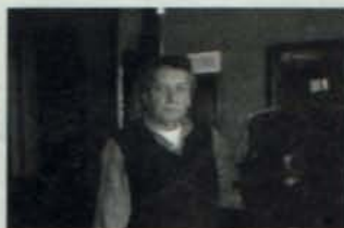
Por: Lucho Arenas Godoy

Imprime: Pedro Millacura, Isabel Riquelme 529-b, F. 359 47 44, San Joaquín.