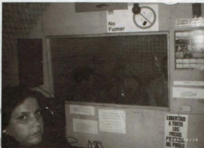
Las radios comunitarias cada día le conquistan nuevos espacios a la radio comercial. (Radio 1° Mayo Población La Victoria)

Ubicada en el dial 105.3 FM, Radio Ciudadanía nace a través de un convenio entre la Asociación Nacional de Radios Comunitarias y Ciudadanas de Chile (ANARCICH) y la Universidad Bolivariana, para fomentar la comunicación comunitaria entre los vecinos del Barrio Yungay y ser un mecanismo de participación activa donde todos tengan cabida sin distinción alguna. De lunes a sábado, más de quince programas se mantienen al aire tocando distintas temáticas de actualidad.