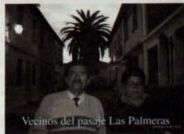
Vecinos del pasaje Las Palmeras

El Comité de Adelanto del Barrio Yungay, la Universidad Bolivariana y el Instituto Nacional de la Juventud comenzarán este viernes 15 de octubre hasta diciembre "El Reencuentro de Jóvenes con los Pasajes y Cités del Barrio Yungay". Una iniciativa que pretende acercar el teatro juvenil a los pasajes y cités del barrio. El proyecto consiste en una primera etapa en la representación de piezas teatrales clásicas, un diálogo abierto con los vecinos y una convivencia. En una segunda etapa el plan consistirá en representar una obra juvenil - en elaboración - en un pasaje patrimonial y abierto a toda la comunidad del barrio.