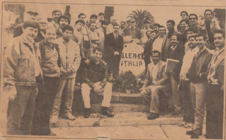
5 de noviembre visita a la tumba del Presidente Salvador Allende G., Cementerio Santa Inés de Viña del Mar.