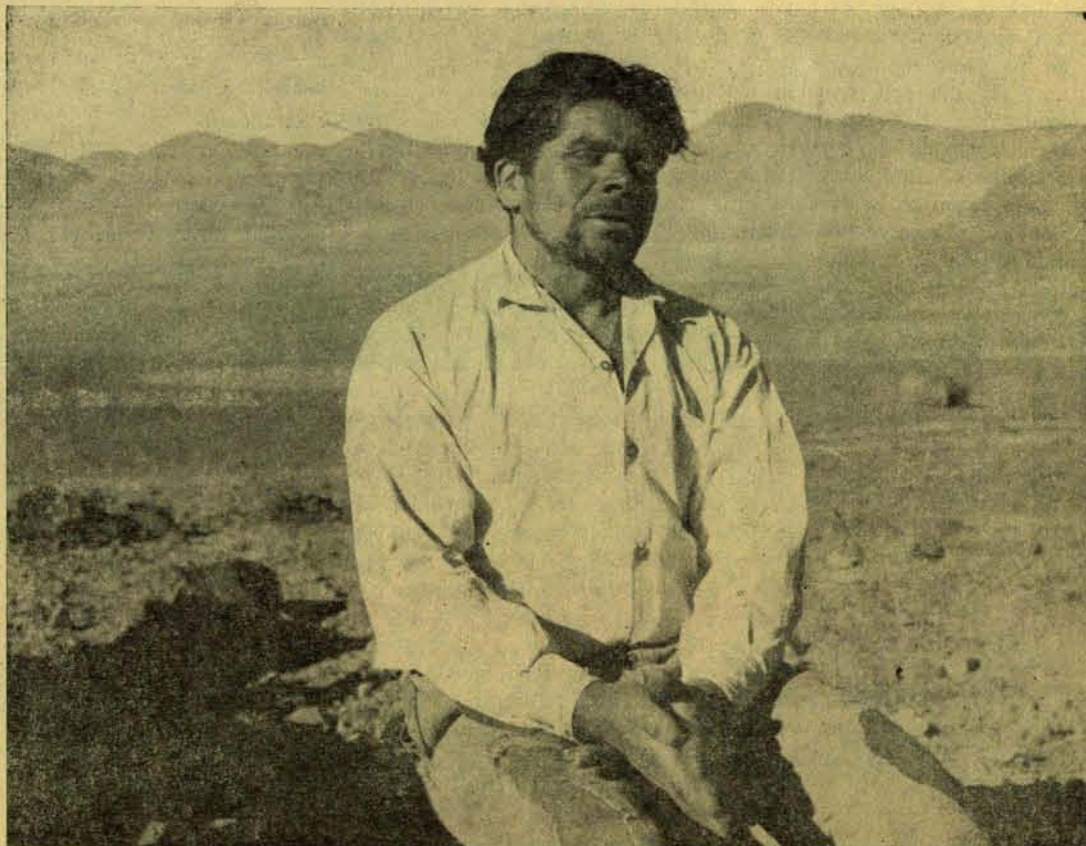
Los poderosos se dividen el mundo, y nosotros ¿qué...?