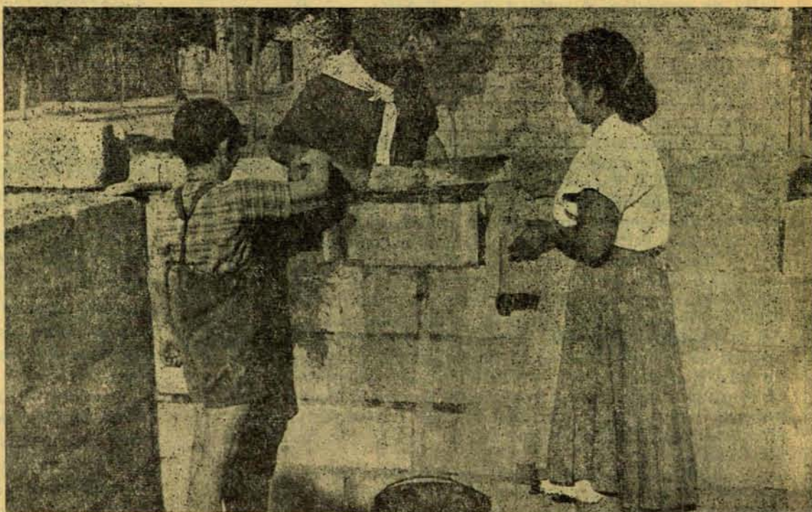
Hay que participar en la construcción de la comunidad.