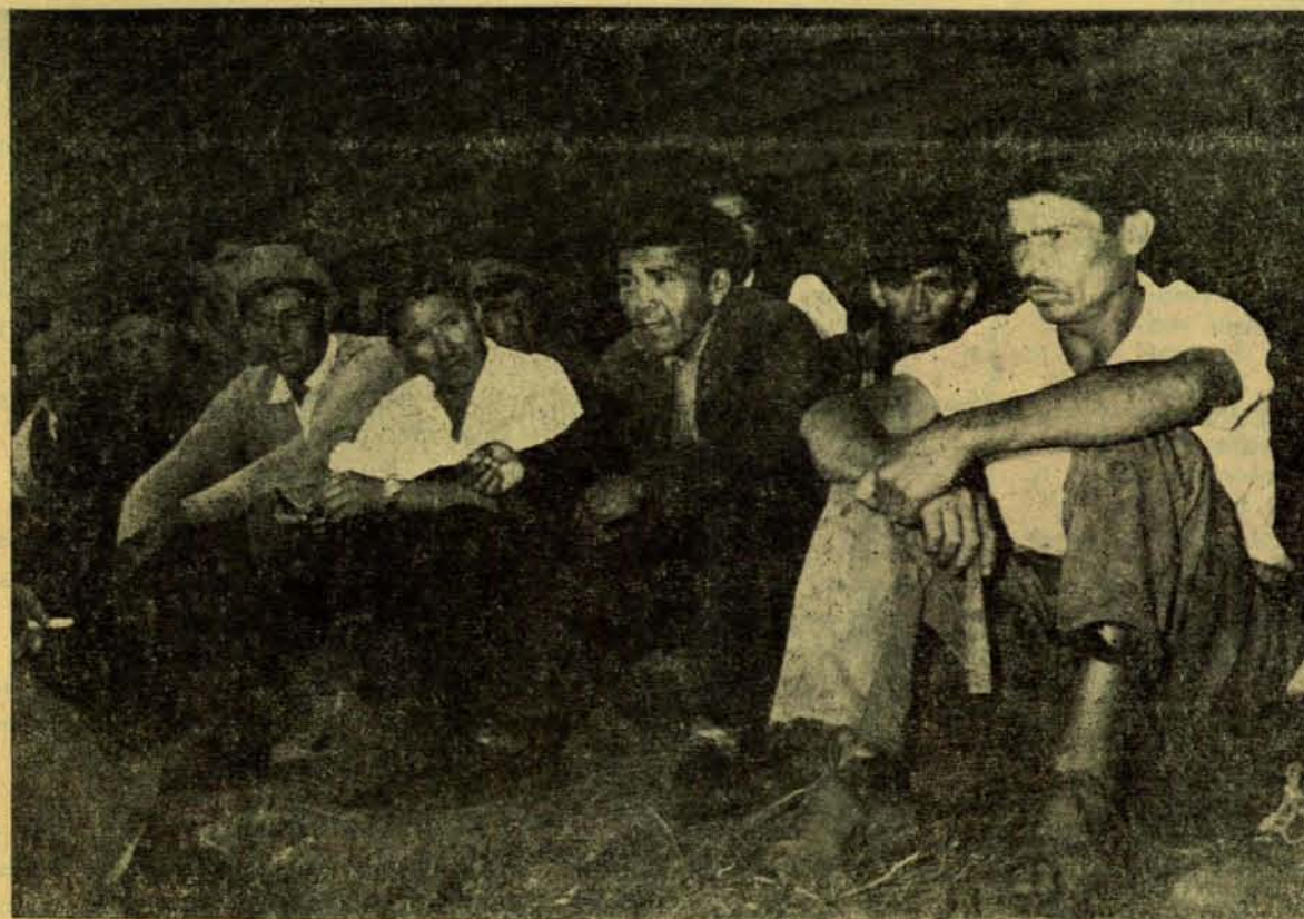
La Cesantía, grave problema de los trabajadores.

El Gobierno Pide Producir Más.... Los Empresarios Producen.... Más Cesantía No se Respeta el Derecho al Tra- bajo, Unico Medio de Vida del Trabajador