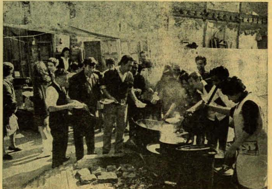
100 días de huelga y 6 meses sin sueldo...