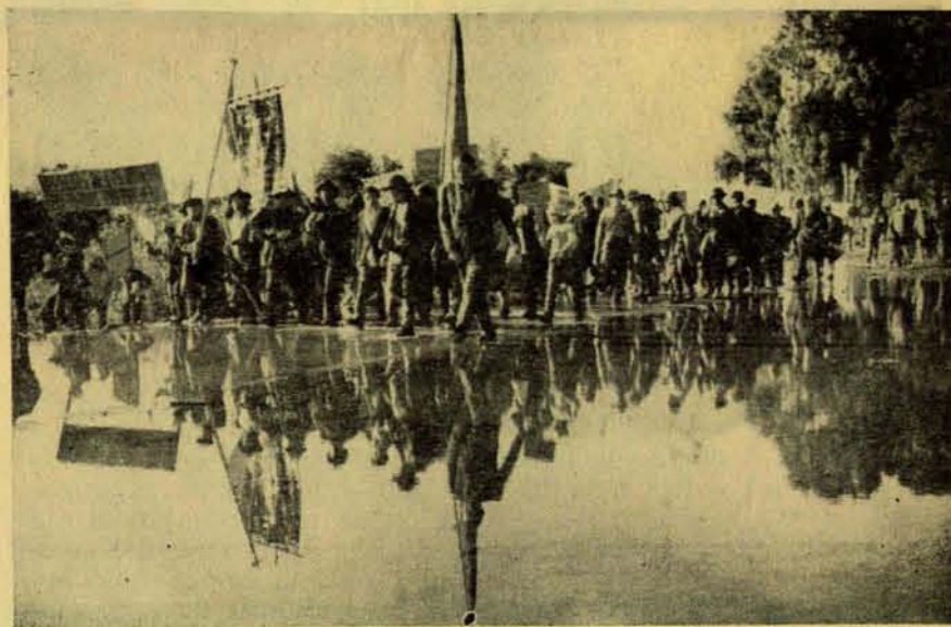
Lucha obrera: protesta organizada contra aplastamiento.

EL REVANCHISMO: tentación de transformarse en la nueva clase dominante según el actual modelo de la sociedad burguesa en la cual los que tienen el poder —sean estos muchos o pocos— oprimen a los demás, en lugar de construir una sociedad fraternal de iguales;