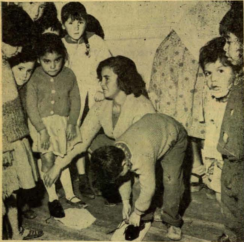
Trabajo de la mujer: una solución desesperada para muchas madres.

Serán las organizaciones populares: sindicatos, Centros de Padres y Apoderados, Centros de madres; organizaciones del profesorado, etc., los únicos que podrán urgir soluciones reales, pero para esto se requiere que tomen conciencia de los problemas de los jóvenes y de que la presión de ellos puede acelerar las soluciones.